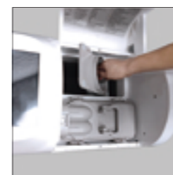
2.将底托水侧倒到储水桶提出底托。