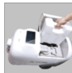
1.首先打开主机盖，取出清水桶，将清水桶内的水倒完。