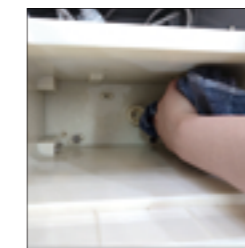
5.最后用毛巾擦干储水桶内壁及用毛巾吸出桶底小圆槽内残余水。