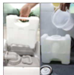
2.给净水桶内装上水即可。