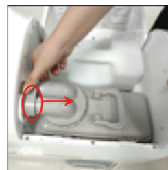
4.在安装污水桶时，向下按下灰色卡扣，听到“咔嗒”声向内推动连接头，卡紧。