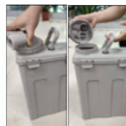
3.将污物倒入便器或便桶，用少许的水冲洗干净即可。