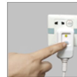
4.插上主机电源，打开主机电源，稍等后机器自动排除内部管道内部余水。