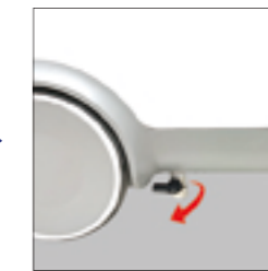
6.排水完成关闭排水阀，成90度垂直即可。