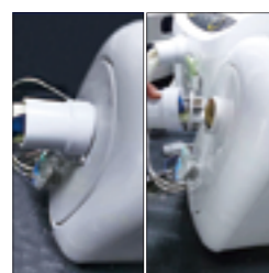
6.将软管与主机连接。