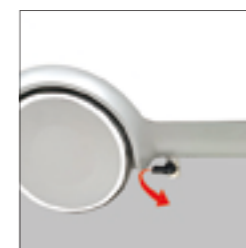
3.打开排水阀排水，等待排完储水桶内水。