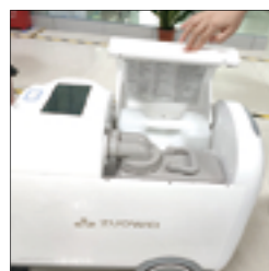
1.首先打开机器上部盖子。