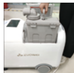
3.将污水桶放置机器内。